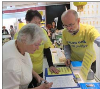
图：法轮功学员做专题报告，并展示功法。右图：波兰民众签名谴责中共迫害