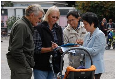
图：奥地利民众签名谴责中共暴行

二零零六年三月初，多位证人向国际社会曝光中共在苏家屯等至少三十六个集中营活体摘取法轮功学员器官以牟取暴利并焚尸灭迹的反人类暴行。随后的多方独立调查都证实了这一指控是真实的。二零一二年九月，美国国会举行了关于中共活摘器官的听证会。两个非政府组织也在九月举行的联合国人权理事会上发