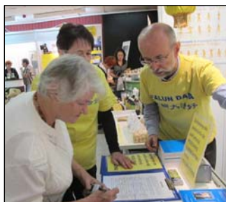
图：法轮功学员做专题报告，并展示功法。右图：波兰民众签名谴责中共迫害

二零一二年十月五日至七日，第三十六届波兰健康博览会上，民众热衷学炼法轮功，并积极响应法轮功学员举办的讲真相、反对中共活摘器官恶行的征签活动。