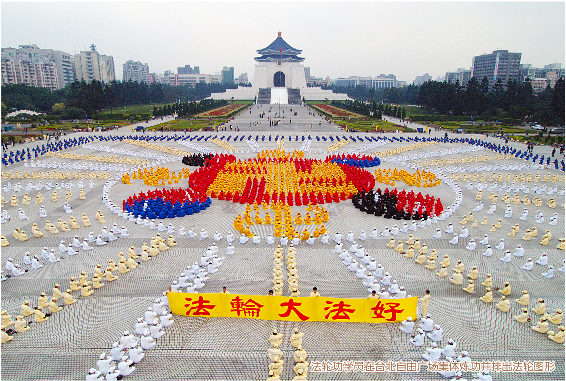
法轮功学员在台北自由广场集体炼功并排出法轮图形