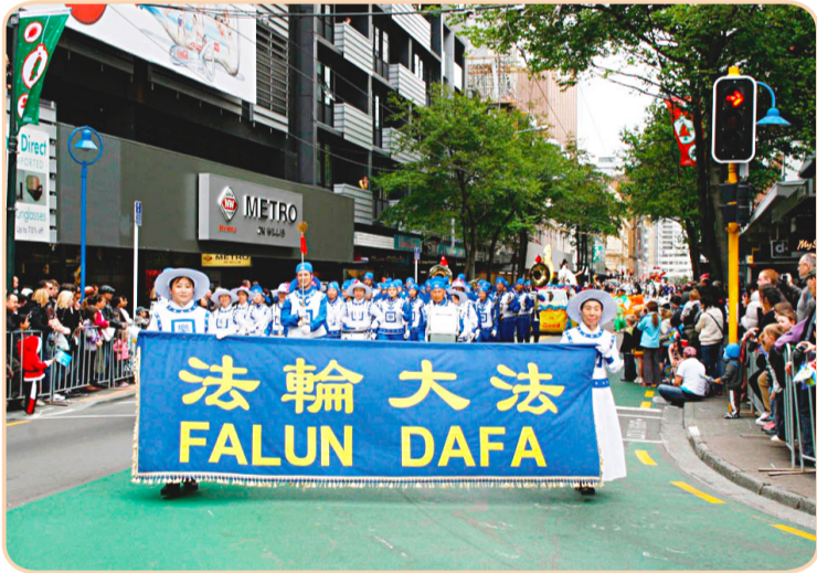
新西兰首都大游行 法轮功受民众欢迎

在地处南半球的澳大利亚和新西兰，法轮功受到了广泛的褒奖和支持，炼功点遍布各大城市。 在新西兰，政府宣布了“新西兰法轮大法日”、“法轮大法周”，呼吁各界支持法轮大法。多位部长及高级政要致信或发言，表示支持法轮功。 在澳大利亚，法轮功受到从国会议员、总理，到部长、省长的褒奖和支持。早在 2005 年，澳大利亚参议院就通过第 170 号动议案，保障本国法轮功修炼者的权益，呼吁政府彻底调查中共特务骚扰本国法轮功学员的事件。2007 年，总理霍华德委托其国际事务资深顾问致信法轮功学员说：中共取缔法轮功及对待法轮功修炼者的做法违反了基本人权，政府对此表示关注。2008 年 6 月，参议院再次一致通过第 127 号动议案，要求中共政权停止迫害法轮功。 在悉尼，一年一度的“法轮大法日”大游行，被写进了政府日程中，受到法律保护。