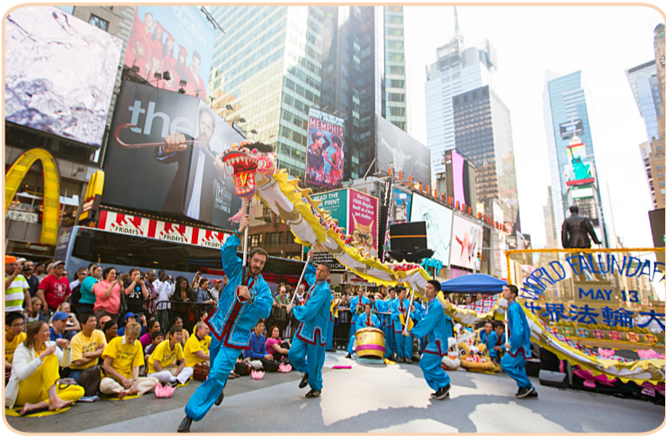
纽约西人法轮功学员舞龙欢庆 “5·13 世界法轮大法日”

在美国 50 个州中，47 个州有法轮功炼功点，修炼者很多是科学家、工程师、教授和研究生。 每年 7 月，都有数千法轮功学员汇集首都华盛顿，向世界呼吁“制止中共对法轮功学员的残酷迫害”。法轮功学员 13 年和平讲真相，赢得世界的尊重与支持。美国国会议员和人权组织等团体的代表赞扬法轮功学员坚持正信的勇气；美国国会已通过多项决议谴责中共，要求中共立即停止迫害，释放所有被关押的法轮功学员。 法轮功在加拿大已深入人心。每年 5 月，是全球民众庆祝法轮大法弘传世界的月份，2012 年 5 月，总理哈珀连续第 7 年给“法轮大法月”发来贺信说：“今年庆祝法轮大法开传 20 周年的活动，是我们加拿大多元化的杰出成果。我在此要赞扬加拿大法轮大法学会同我们分享你们的修炼和传统。”加拿大多位联邦部长、省市政要也纷纷称赞法轮功学员的坚忍宽容，称赞“真善忍”理念启迪世人，造福社会。