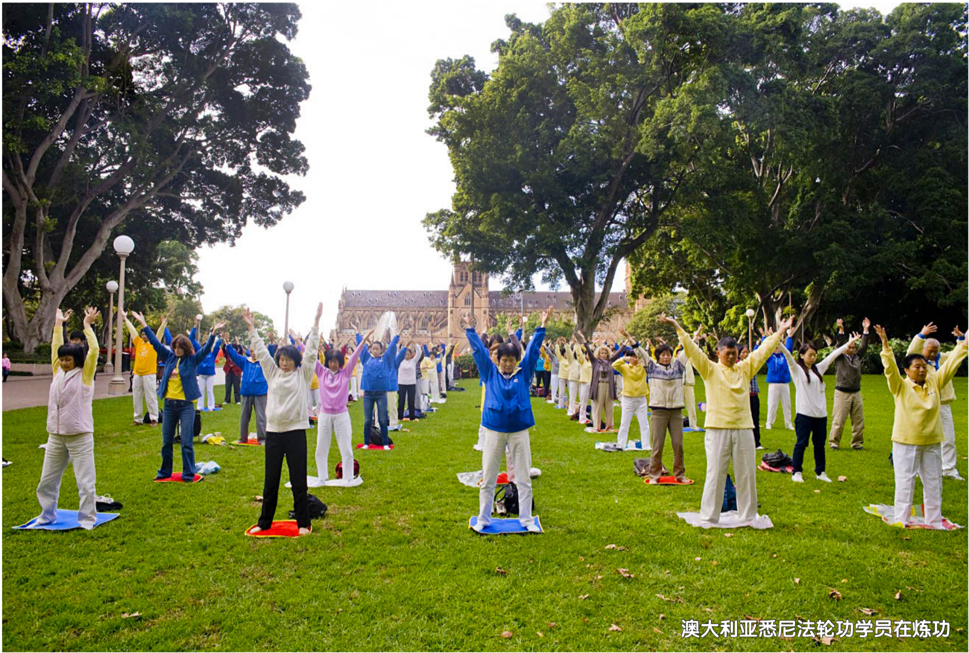
澳大利亚悉尼法轮功学员在炼功

在地处南半球的澳大利亚和新西兰，法轮功受到了广泛的褒奖和支持，炼功点遍布各大城市。 在新西兰，政府宣布了“新西兰法轮大法日”、“法轮大法周”，呼吁各界支持法轮大法。多位部长及高级政要致信或发言，表示支持法轮功。 在澳大利亚，法轮功受到从国会议员、总理，到部长、省长的褒奖和支持。早在 2005 年，澳大利亚参议院就通过第 170 号动议案，保障本国法轮功修炼者的权益，呼吁政府彻底调查中共特务骚扰本国法轮功学员的事件。2007 年，总理霍华德委托其国际事务资深顾问致信法轮功学员说：中共取缔法轮功及对待法轮功修炼者的做法违反了基本人权，政府对此表示关注。2008 年 6 月，参议院再次一致通过第 127 号动议案，要求中共政权停止迫害法轮功。 在悉尼，一年一度的“法轮大法日”大游行，被写进了政府日程中，受到法律保护。