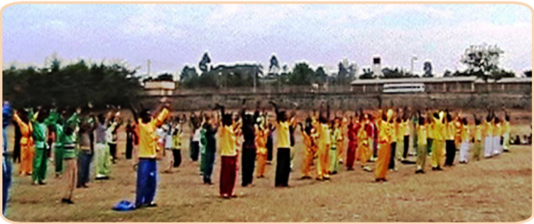
200 多名埃塞俄比亚法轮功学员集体炼功

2004 年,原吉林省委副书记苏荣访问赞比亚时,因对法轮功学员犯下了谋杀、酷刑折磨和侮辱罪行被起诉。面对逮捕令,苏荣在中国大使馆的协助下偷越边境,辗转多国逃回北京。同年,在坦桑尼亚,前教育部长陈至立,因“对法轮功学员实施酷刑和虐杀”,也在出访期间被法庭传唤应讯。