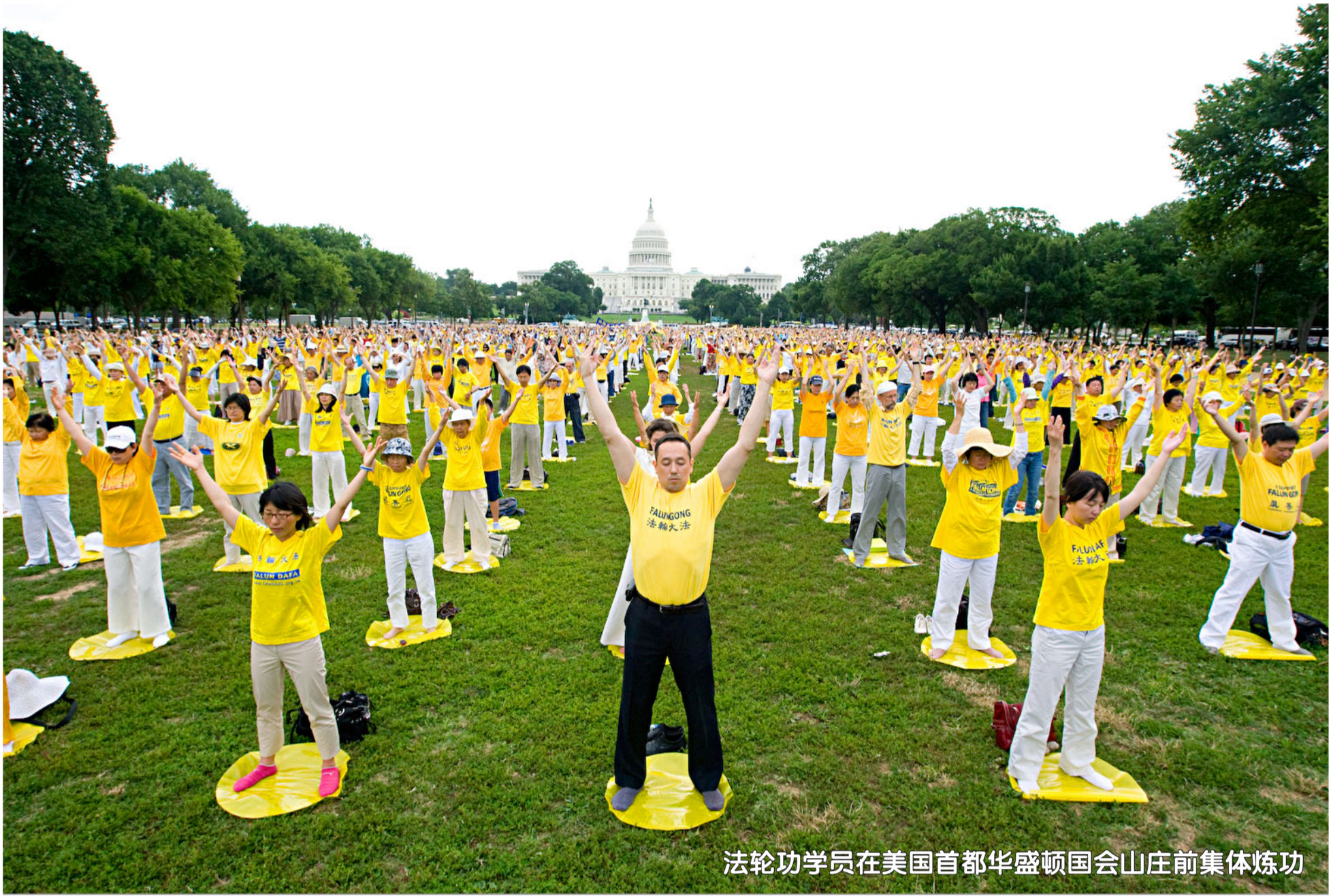
法轮功学员在美国首都华盛顿国会山庄前集体炼功

在美国 50 个州中，47 个州有法轮功炼功点，修炼者很多是科学家、工程师、教授和研究生。 每年 7 月，都有数千法轮功学员汇集首都华盛顿，向世界呼吁“制止中共对法轮功学员的残酷迫害”。法轮功学员 13 年和平讲真相，赢得世界的尊重与支持。美国国会议员和人权组织等团体的代表赞扬法轮功学员坚持正信的勇气；美国国会已通过多项决议谴责中共，要求中共立即停止迫害，释放所有被关押的法轮功学员。 法轮功在加拿大已深入人心。每年 5 月，是全球民众庆祝法轮大法弘传世界的月份，2012 年 5 月，总理哈珀连续第 7 年给“法轮大法月”发来贺信说：“今年庆祝法轮大法开传 20 周年的活动，是我们加拿大多元化的杰出成果。我在此要赞扬加拿大法轮大法学会同我们分享你们的修炼和传统。”加拿大多位联邦部长、省市政要也纷纷称赞法轮功学员的坚忍宽容，称赞“真善忍”理念启迪世人，造福社会。