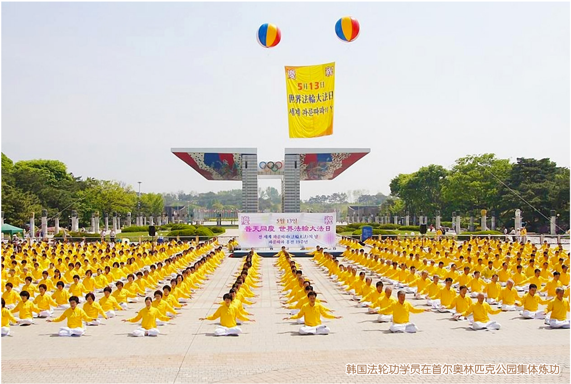
韩国法轮功学员在首尔奥林匹克公园集体炼功

只要离开中国大陆，在亚洲各地到处都可看到法轮功学员炼功、讲真相的身影。 印度是释迦牟尼传出佛法之地，自古有佛国之称，纯朴敦厚的印度人民也有幸沐浴在法轮大法的祥和美好中。班加罗尔（Bangalore）是全印度修炼法轮功人数最多的地区，有超过 80 所大中小学的师生炼法轮功，《转法轮》（法轮功主要著作）中的《论语》被纳入印度学校英文教材的卷首，五套功法被列为体育课内容，师生身心健康得到极大改善。 在韩国，法轮大法炼功点多达几百个，遍及各地。韩国各界及政要对大法弘传本国深表谢意。亚洲哲学会会长、釜山大学哲学教授崔佑源先生说：“从实践法轮大法最高精神世界的法轮功学员们身上，能找到全世界的希望。”韩国总统直属宪法机构的常任委员洪俊容先生，在 2012 年 5 月 13