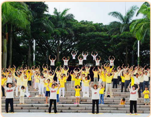
新加坡法轮功学员在集体炼功

日庆祝“世界法轮大法日”的活动上发表贺词说：“实在不理解中共为什么要镇压实践‘真、善、忍’美德的人们，应该无条件地结束对法轮功学员们的人权迫害。” 2003 年，《转法轮》（越南文版）出版。此后，在这个鱼米之乡，法轮大法迅速传播，来自各界的越来越多的越南人加入修炼行列，践行同化宇宙特性“真、善、忍”，做一个好人。如今，炼功点已经遍布越南各地。