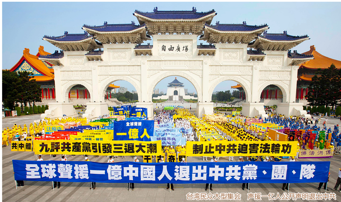
台湾民众大型集会 声援一亿人公开声明退出中共