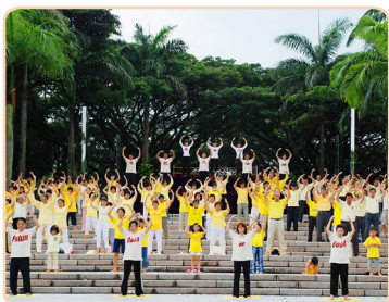
新加坡法轮功学员在集体炼功

在韩国，法轮大法炼功点多达几百个，遍及各地。韩国各界及政要对大法弘传本国深表谢意。亚洲哲学会会长、釜山大学哲学教授崔佑源先生说：“从实践法轮大法最高精神世界的法轮功学员们身上，能找到全世界的希望。”韩国总统直属宪法机构的常任委员洪俊容先生，在 2012 年 5 月 13 日庆祝“世界法轮大法日”的活动上发表贺词说：“实在不理解中共为什么要镇压实践‘真、善、忍’美德的人们，应该无条件地结束对法轮功学员们的人权迫害。”