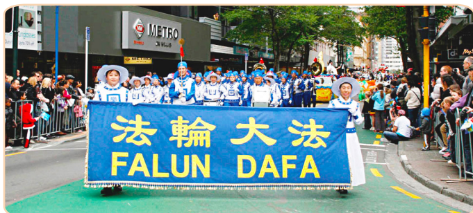
新西兰首都大游行 法轮功受民众欢迎