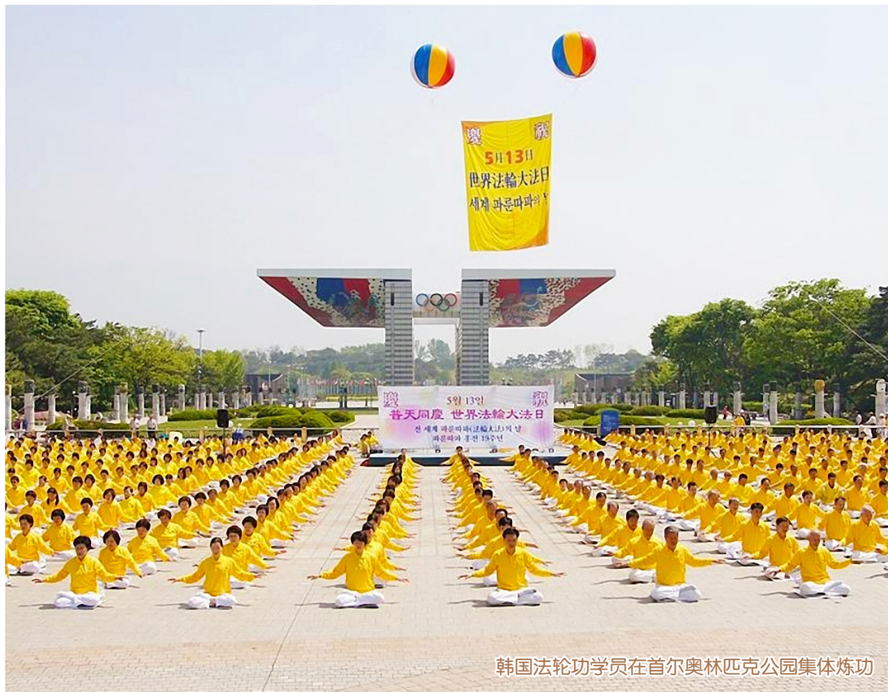
韩国法轮功学员在首尔奥林匹克公园集体炼功

2003 年，《转法轮》（越南文版）出版。此后，在这个鱼米之乡，法轮大法迅速传播，来自各界的越来越多的越南人加入修炼行列，践行同化宇宙特性“真、善、忍”，做一个好人。如今，炼功点已经遍布越南各地。