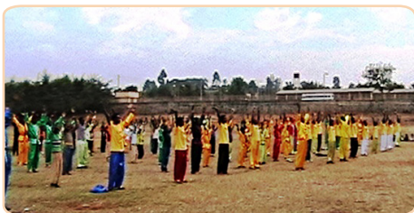
200多名埃塞俄比亚法轮功学员集体炼功

回北京。同年，在坦桑尼亚，前教育部长陈至立，因“对法轮功学员实施酷刑和虐杀”，也在出访期间被法庭传唤应讯。