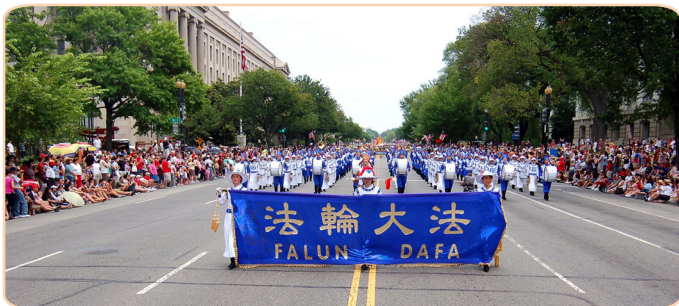
受邀参加美国国庆大游行，百万人目睹法轮功学员的风采。

法轮功在加拿大已深入人心。每年 5 月，是全球民众庆祝法轮大法弘传世界的月份，2012 年 5 月，总理哈珀连续第 7 年给“法轮大法月”发来贺信说：“今年庆祝法轮大法开传 20 周年的活动，是我们加拿大多元化的杰出成果。我在此要赞扬加拿大法轮大法学会同我们分享你们的修炼和传统。”加拿大多位联邦部长、省市政要也纷纷称赞法轮功学员的坚忍宽容，称赞“真善忍”理念启迪世人，造福社会。