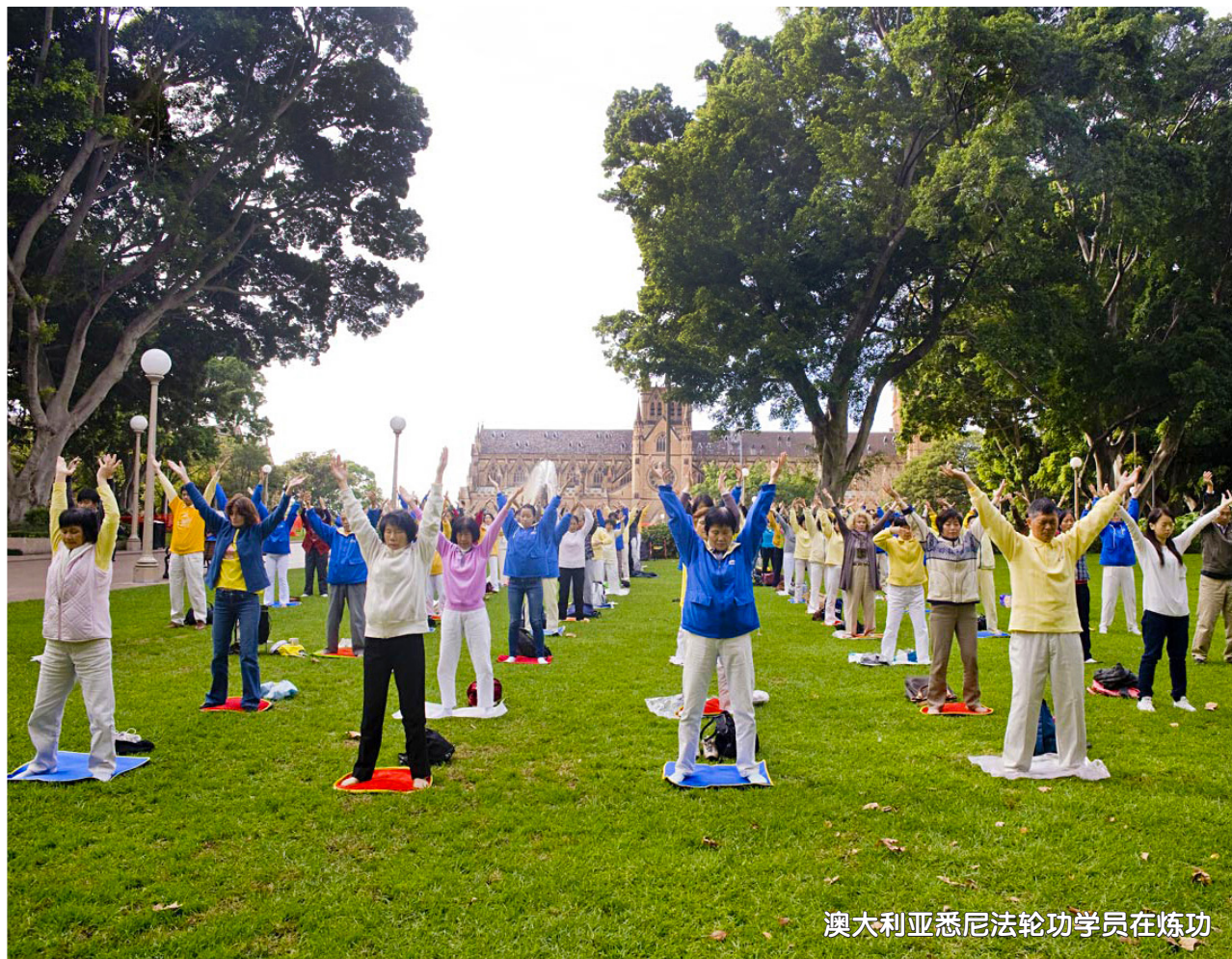
澳大利亚悉尼法轮功学员在炼功