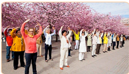
瑞典法轮功学员在皇家公园炼功

早在 20 年前，控制东欧九国的共产主义暴政，就被欧洲人民埋葬了。2006 年 1 月 27 日，波兰、捷克、匈牙