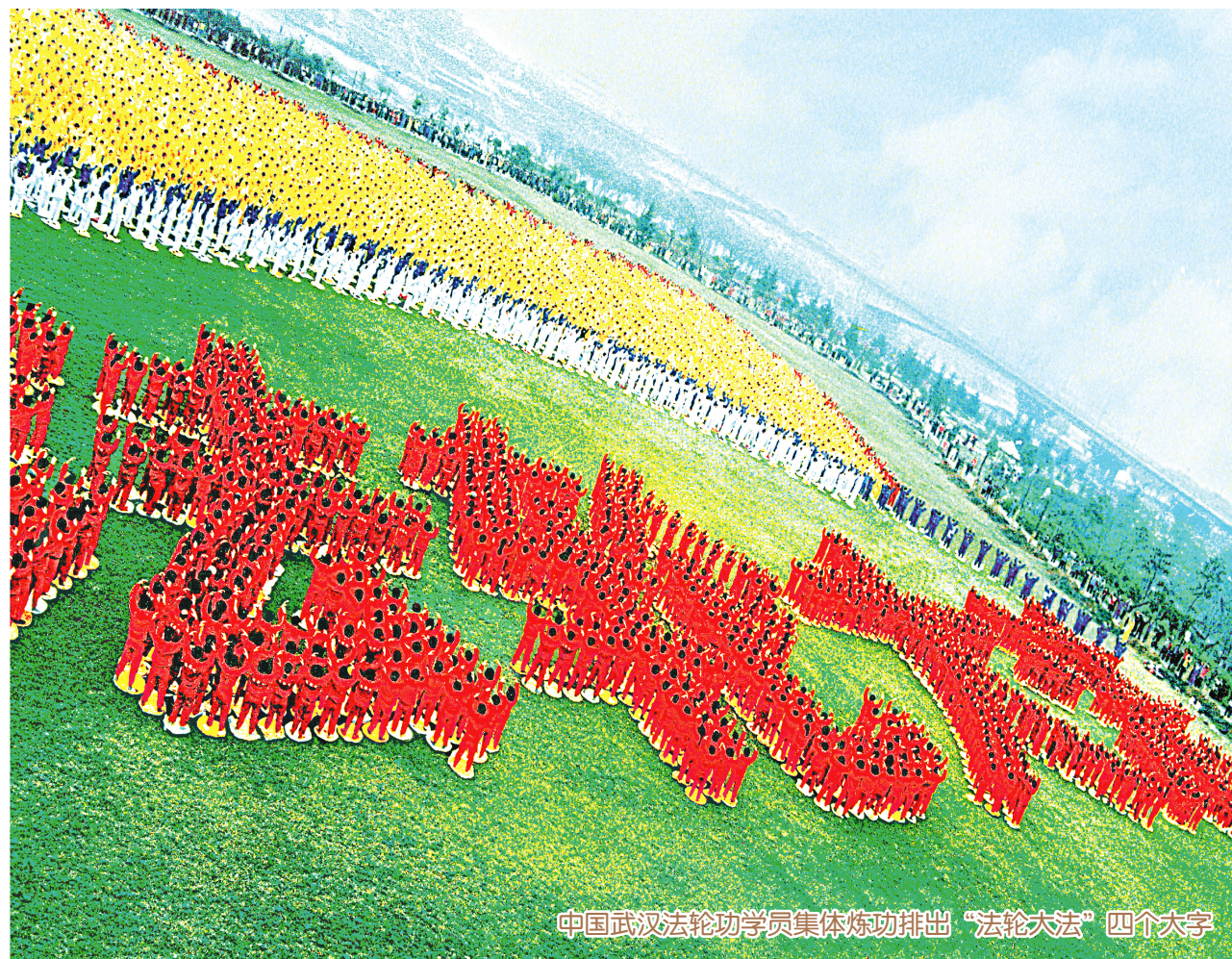
中国武汉法轮功学员集体炼功排出“法轮大法”四个大字

法轮大法明慧网（ www.minghui.org ）可免费下载法轮功的书籍和音像资料。