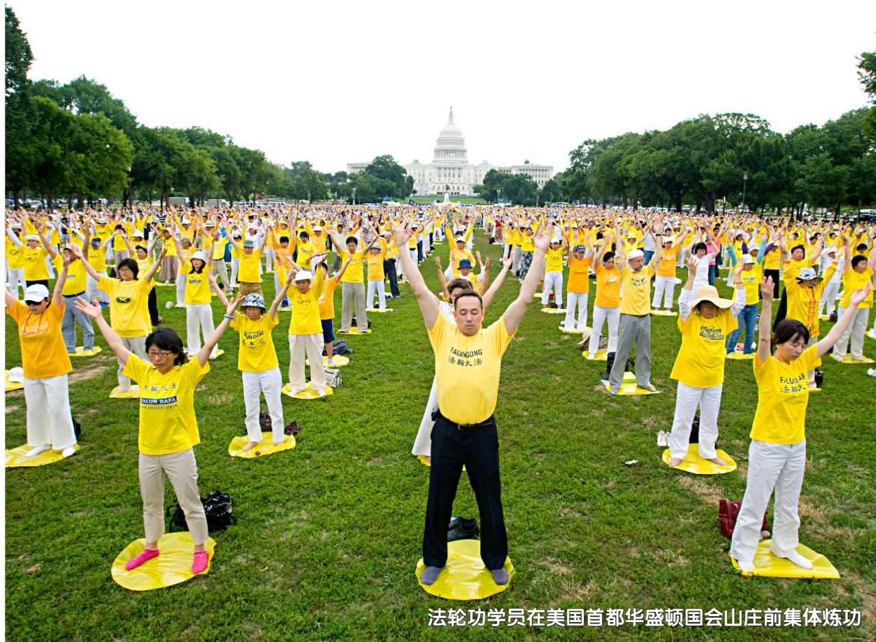
法轮功学员在美国首都华盛顿国会山庄前集体炼功