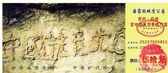
贵州省平塘县风景区门票