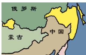
至少达100多万平方公里被侵占的中国领土被江泽民正式划入俄罗斯

■2002年6月，贵州平塘县掌布乡发现了距今二亿七千万年的“藏字石”，石头断面上显现“中国共产党亡”六个大字(见上图藏字石风景区门票)，后被中科院地质专家鉴定为天然形成。天灭中共，天意不可违。