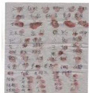
图：当地老百姓共 676 人签名呼吁释放法轮功学员