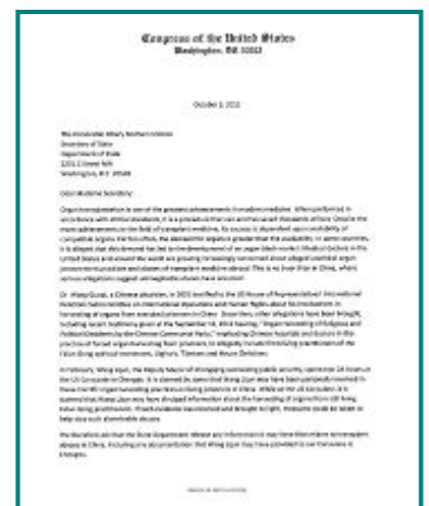
图：一百零六位美国国会议员致国务卿的联名信，要求公开中共活摘器官罪行