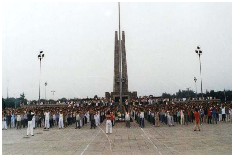
一九九九年以前唐山民众在街心广场炼法轮功