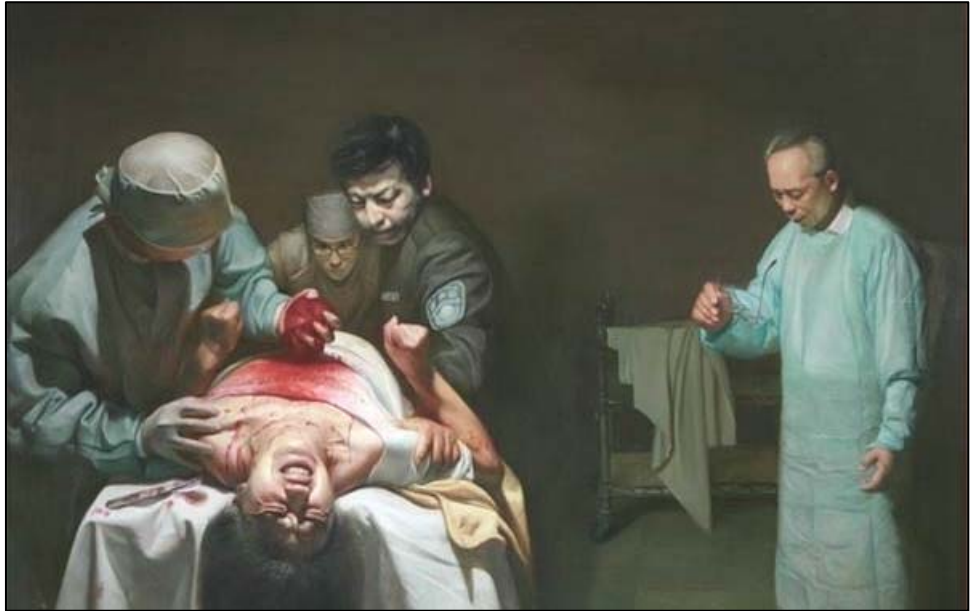
《活摘器官的罪恶》，董锡强，油画，54×54 英寸，2007 年。