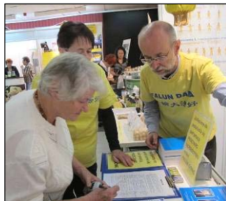
图：法轮功学员做专题报告，并展示功法。右图：波兰民众签名谴责中共迫害