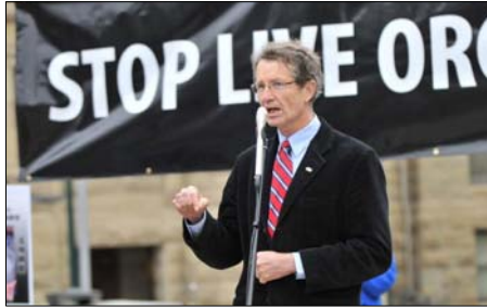
图：亚省省议员大卫·斯旺博士发言于加拿大人民的福祉。”

亚省省议员，前自由党领袖大卫·斯旺博士在集会上呼吁加拿大政府对中共迫害法轮功修炼者事件进行调查，必须制止这一长期的迫害。“与一个无论是制度、劳工、环境以及人权等等方面都不同的国家交易，不利