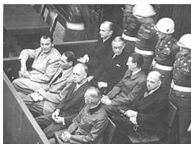
图：纽伦堡审判图片。 1945 年二战结束后，纽伦堡国际军事法庭否决了迫害帮凶们“奉命行事”的辩解。

退党团队方法(真名、化名、笔名同样有效)：* 退党电话：001-416-361-9895, 001-702-873-1734 * 退党传真：001-702-248-0599 * 退党电邮：tuidang@epochtimes.com * 无法上网者可将声明张贴在公共场所，以后再上网。