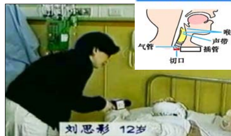
气管切开插管示意图

国际教育发展组织（IED）2001年8月14日在联合国会议上，就天安门自焚事件，强烈谴责中共的“国家恐怖主义行为”。声明说：从录像分析表明，整个事件是“政府一手导演的”。中国代表团面对确凿的证据，没有辩辞。该声明已被联合国备案。