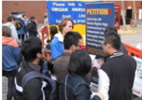
▲法轮功学员在伦敦唐人街举办劝三退、反活摘器官征签活动，吸引许多中、西方民众驻足了解真相。

德国美因茨（Mianz）民众说：“这不是人干的事。”“共产党是最邪恶的！”一位瑞士妇女听了活摘器官的事情后说：“这哪是人干的事啊？干出这事的就不是人了！”一位来自摩洛哥的人权律师静静阅读了展板上的内容后，说：“这是群体灭