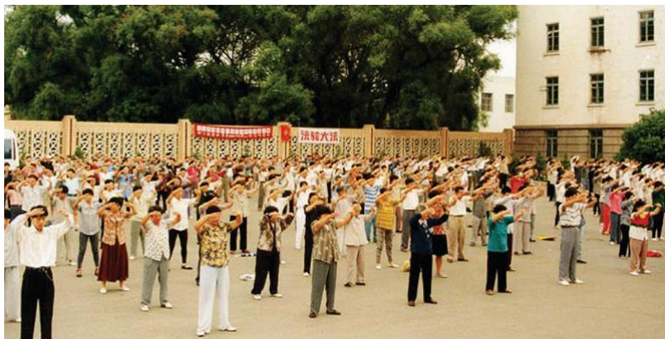
历史图片：1999年迫害发生前大陆法轮功学员集体炼功

从那天起，我象变了一个人似的。酒不喝了，也干家务活了，以前在家什么活都不干。看到我洗衣服、做饭，妻子觉得简直太阳从西边出来了，怎么也不相信我突然间能变得这么好。过去别说我不做饭，她要是饭做得不好吃，我是说摔锅就摔锅，说