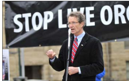
图：亚省省议员大卫·斯旺博士发言

亚省省议员，前自由党领袖大卫·斯旺博士在集会上呼吁加拿大政府对中共迫害法轮功修炼者事件进行调查，必须制止这一长期的迫害。“与一个无论是制度、劳工、环境以及人权等等方面都不同的国家交易，不利