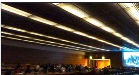
图：影片《自由中国》、《生死之间》在日内瓦联合国人权理事会大会的会场——万国宫内放映。

该影片从近十年来中国的器官移植手术量暴增和超短的等待器官时间谈起，展开了对大量的不明器官供体的调查。通过分析中共官方的器官移植数据及媒体报导，采访大量调查人员、专家和证人，证实了中共政权为了牟取暴利，系统建立法轮功学员及其他政治犯活体器官库，按需杀人、活体摘取器官的惊天罪行。