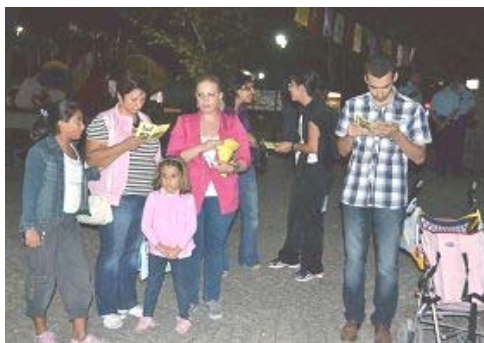
图：纷纷主动前来了解法轮功真相

【明慧网】二零一二年九月二十一日，土耳其部份法轮功学员在安卡拉市著名的天鹅公园（Kugulu Park）举行活动，向当地民众介绍以“真、善、忍”为修炼原则的法轮功，揭露中共对法轮功学员的血腥迫害，呼吁善良的土耳其民众起来共同制止中共的暴行。临近傍晚时分，学员们在公园内游人必经之处，拉起醒目的“法轮大法好”横幅，在悦耳动听的炼功音乐伴随下，演示了舒缓优美的五套功法，并向围观的民众派发了大量法轮功简介以及揭露中共迫害法轮功罪行的真相资料。土耳其知名电视台 Haber Turk 和报纸全国发行量高居第二位的《早报》（Sabah）等媒体的记者，均赶来活动现场进行了采访。