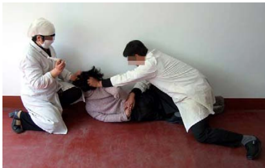
酷刑演示：打毒针（注射不明药物）