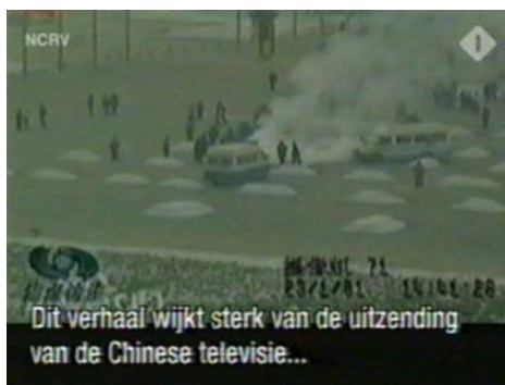
图: 荷兰国家电视一台 2005 年 3 月 14 日在「时事评论」专题播放法轮功节目,其中揭露了中央电视台「自焚」伪案,质疑两辆警车为何备有(按中共媒体报导的)二十多个灭火器。

每早例会,各报主编、各部主任要听明白两点:一个是不准报道的真新闻;一个是必须报的假新闻。记忆中,有一阵电视里天天“法轮功”,播音员无论男女,表情严厉,口气尖