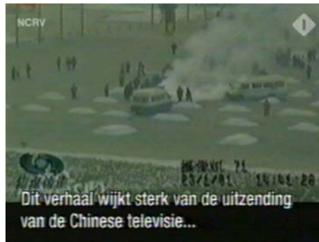
图:荷兰国家电视一台 2005 年 3 月 14 日在「时事评论」专题播放法轮功节目,其中揭露了中央电视台「自焚」伪案,质疑两辆警车为何备有(按中共媒体报导)二十多个灭火器。

每早例会,各报主编、各部主任要听明白两点:一个是不准报道的真新闻;一个是必须报的假新闻。记忆中,有一阵电视里天天“法轮功”,播音员无论男女,表情严厉,口气尖