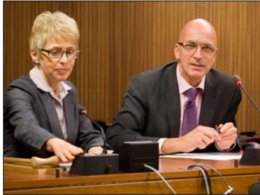
图：日内瓦州大议会人权委员会主席方奎特先生：把真相告诉给每一个人。

日内瓦州大议会人权委员会主席马克·方奎特先生表示，对“中共作为一个政府系统地组织这样的犯罪”感到震惊。他认为真相会曝光和制止邪恶，“每个人将活摘器官