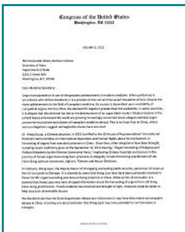
图：一百零六位美国国会议员致国务卿的联名信，要求

动态网近期网址 http://mk.mindhackz.info 或 http://gb.esculturatactil.com 安全访问被封网站，了解外界真实信息！