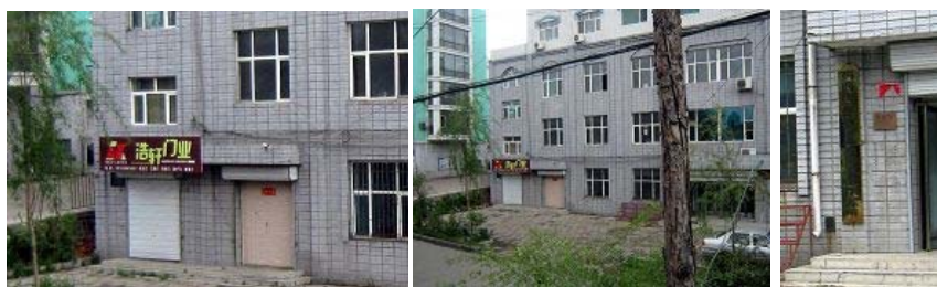
鸡西市洗脑班位于鸡西市电台路 47 号。电台名苑小区大门右侧一楼干休所左侧。