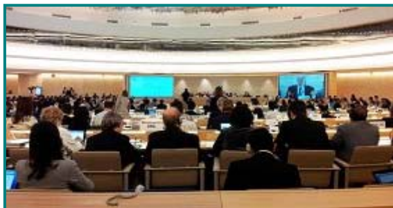
图：联合国人权理事会第二十一次会议在联合国日内瓦万国宫召开

【明慧网】（明慧记者唐恩综合报道）二零一二年九月十七日，联合国人权理事会第二十一次会议在联合国日内瓦万国宫召开。世界一百九十多个国家的代表和在联合国获得观察员身份的二百多人权组织的代表出席会议。会议期间，中共活摘法轮功学员器官的罪行被广泛曝光。九月十八日，两个国际非政府组织在联合国人权大会上提出要求联合国紧急调查发生在中国的法轮功学员器官被活摘及被盗卖的人权惨案，与会的各国驻联合国代