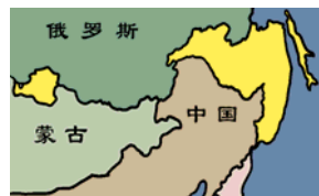
至少达100多万平方公里被侵占的中国领土被江泽民正式划入俄罗斯

■ 2002年6月，贵州平塘县掌布乡发现了距今二亿七千万年的“藏字石”，石头断面上显现“中国共产党亡”六个大字(见上图藏字石风景区门票)，后被中科院地质专家鉴定为天然形成。天灭中共，天意不可违。◇