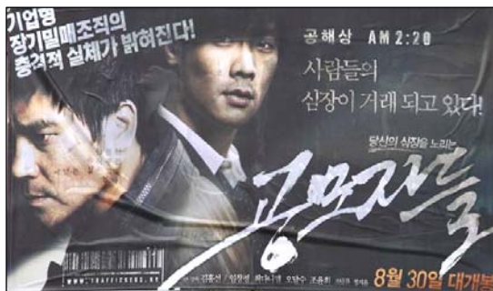
图：反映活摘器官的影片《同谋者们》海报

在听证会的最后，罗拉巴克议员说：我们今天所关注的，是“这个地球上最邪恶的行径”——对那些因为信仰或政见不同而被监禁的人，那些从没有暴力伤害过别人的人，盗取这些人的器官，并在过程中杀害他们，这是反人类的罪行。我们必须尽最大的努力，找出每一个参与这种罪恶的人，把他们绳之以法。◇