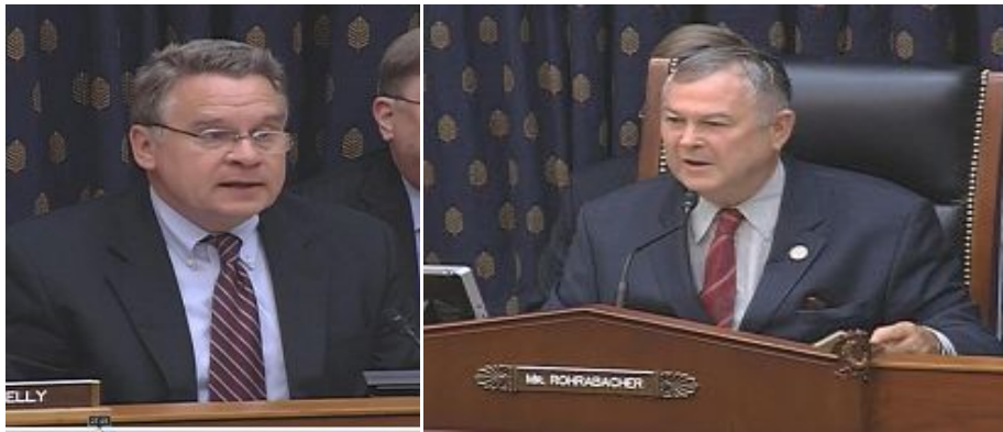
左：众议院外交委员会非洲、全球健康和人权小组委员会主席克里斯·史密斯