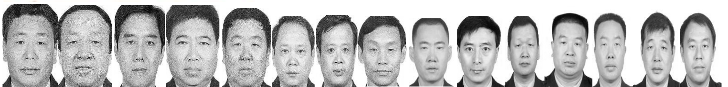
张修平 程印 李庚所 魏永生 吴峰 李颇勇 高金利 葛庆喜 沈迎军 贾英斌 姚建明 李海明 邢延生 王志明 曾毅

退党团队方法(真名、化名、笔名同样有效)：* 退党电话：001-416-361-9895, 001-702-873-1734 * 退党传真：001-702-248-0599 * 退党电邮：tuidang@epochtimes.com * 无法上网者可将声明张贴在公共场所，以后再上网。