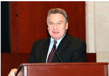
美国众议院人权委员会主席史密斯先生: 感谢影片《自由中国》赋予人希望

美国众议院人权委员会主席史密斯先生: 感谢影片《自由中国》赋予人希望。《自由中国-有勇气相信》九月二十日晚在美国国会山放映, 带给现场观众以震撼和感动。美国众议