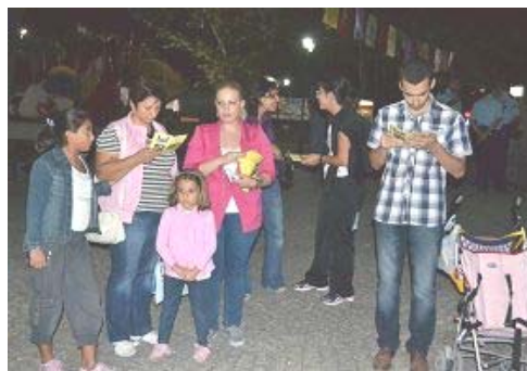
图：纷纷主动前来了解法轮功真相

【明慧网】二零一二年九月二十一日，土耳其部份法轮功学员在安卡拉市著名的天鹅公园（Kugulu Park）举行活动，向当地民众介绍以“真、善、忍”为修炼原则的法轮功，揭露中共对法轮功学员的血腥迫害，呼吁善良的土耳其民众起来共同制止中共的暴行。临近傍晚时分，学员们在公园内游人必经之处，拉起醒目的“法轮大法好”横幅，在悦耳动听的炼功音乐伴随下，演示了舒缓优美的五套功法，并向围观的民众派发了大量法轮功简介以及揭露中共迫害法轮功罪行的真相资料。土耳其知名电视台 Haber Turk 和报纸全国发行量高居第二位的《早报》（Sabah）等媒体的记者，均赶来活动现场进行了采访。