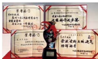
图：93年北京健康博览会上，李洪志先生获“边缘科学进步奖”和“受群众欢迎气功师”称号。

民及其帮凶。包括610办在内的江氏集团及协从者灭绝人性地迫害法轮功学员，其手段之卑鄙，性质之恶劣已经超出了“人”这个字眼的界定，激起了全世界一切有良知的人民的强烈反对。