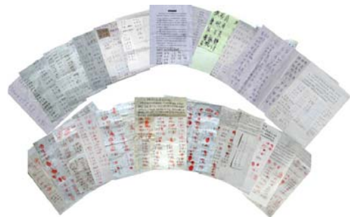
图:第四轮河北 1108 民众声援 700 手印

名的事,一个说:“好说好说,我签。”另一个说:“我也签,共产党这么坏,贪污腐败早该淘汰了,我声援法轮大法!”在乡政府工作的一位干部说:“法轮功学员信仰真善忍,是老百姓公认的好人,整人家法轮功的事情我可不干。那些“610”、公安纯粹是不干正事。营救法轮功学员,我签名。”他还按上了自己的手印。