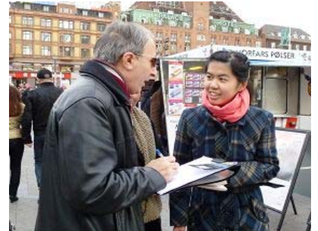
丹麦首都民众签名，谴责活摘器官罪行