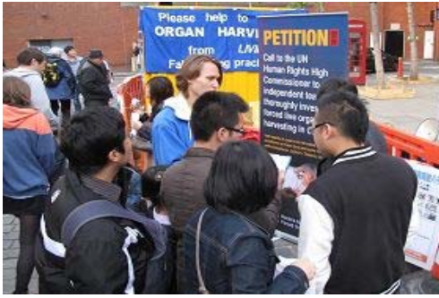
伦敦唐人街举办的三退（退党、退团、退队）、反活摘器官征签活动，吸引许多中、西方民众驻足了解真相

用海外电子信箱给 freeget.ip@gmail.com 发电子邮件, 10 分钟内会拿到几个 IP 地址。突破网络封锁, 访问明慧网 www.minghui.org 了解更多真相!