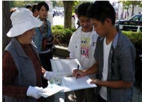
日本东广岛市第二十三届酒节上，游客签名谴责中共活摘器官