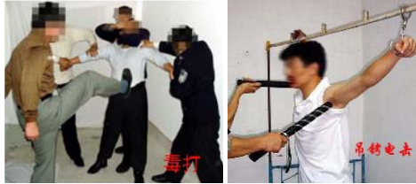
酷刑演示 暴打 电击