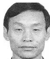
被追查国际追查的恶人

这一件件、一桩桩发生在邯郸劳教所内的罪恶都被一一记录在案，作为将来正义审判那些作恶者的证据。