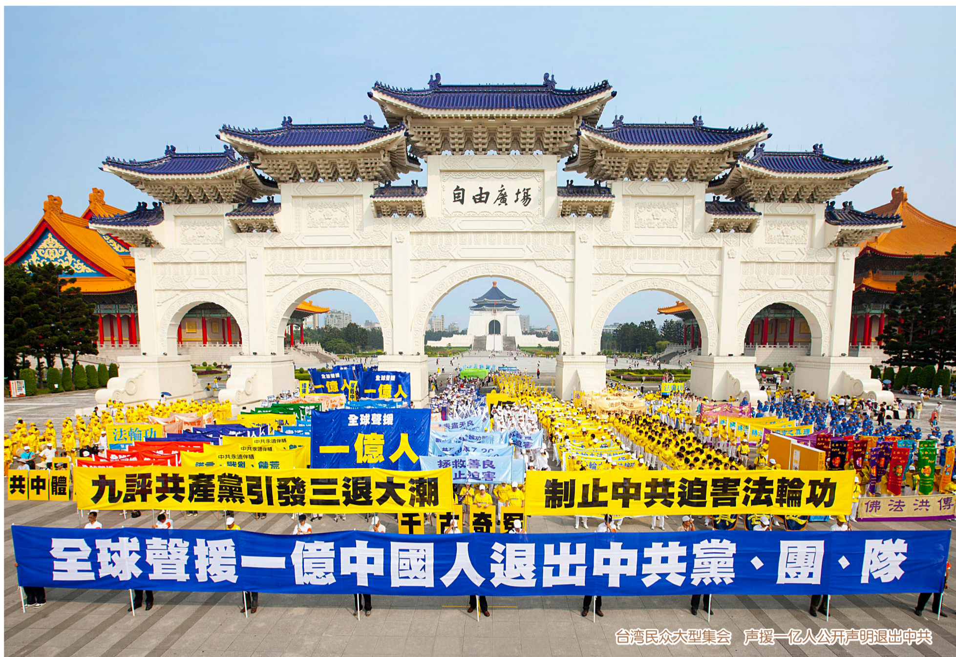
台湾民众大型集会 声援一亿人公开声明退出中共