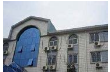
图：法教中心拘禁法轮功学员的楼房

岭组。法教中心直属长沙市“六一零”与市政法委，十年来，已非法拘禁上访维权的长沙市民及湖南各地法轮功学员近千人次。