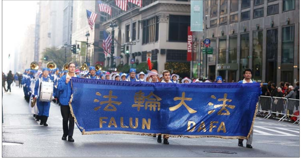
二零一二年纽约老兵节游行中法轮功学员的队伍

到的是我们邀请到的法轮大法游行队伍，他们是退伍军人节游行的老朋友，他们传递着‘真、善、忍’的美好信息，请大家掌声欢迎他们！”