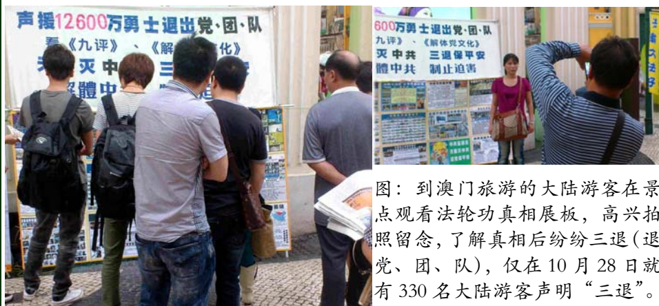
图：到澳门旅游的大陆游客在景点观看法轮功真相展板，高兴拍照留念，了解真相后纷纷三退（退党、团、队），仅在 10 月 28 日就有 330 名大陆游客声明“三退”。