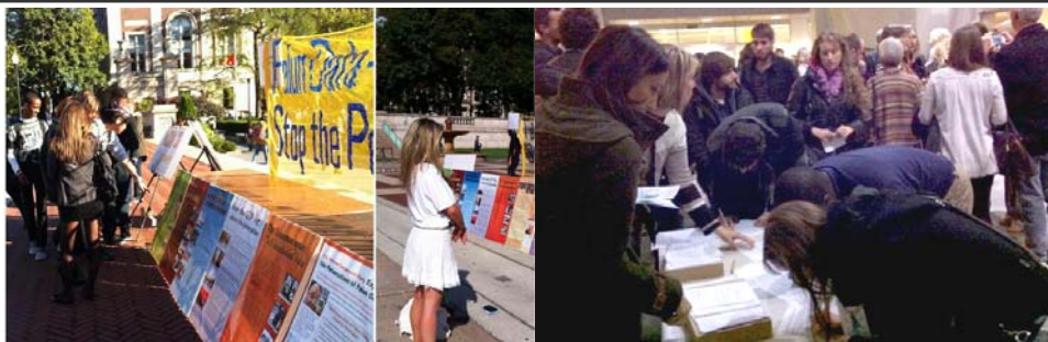
左：哥伦比亚学生在认真阅读真相展板，中：哥大学生现场学法轮功，右：日内瓦大学师生在观看真相影片后，踊跃签名谴责中共活摘器官暴行。