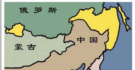
至少达100多万平方公里被侵占的中国领土被江泽民正式划入俄罗斯

中共在历次运动中害死炎黄子孙八千万；将数千年来中华民族的主流文化儒、释、道三教齐灭；认同前苏联将外蒙从中国分裂出去，使外蒙一百六十万平方公里的领土及主权永远被出卖！前中共党魁江泽民总共出卖了东北地区一百四十多万平方公里在历史上有争议的疆土给俄国，相当于四十个台湾的面积。