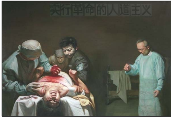
油画：《活摘器官的罪恶》，董锡强，2007 年