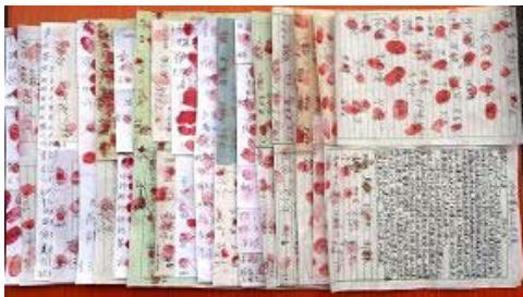
▲湖南郴州百姓超过二千人签名声援营救被绑架的法轮功学员

【明慧网】(明慧网通讯员湖南报道)湖南郴州百姓二千多人签名声援营救被绑架的法轮功学员,呼吁严惩害人凶手。一位男士说:“本人在中共独裁统治中生活了四十多个春秋,深知中共的残暴。五千年的中华文化被其摧残,如今世人都感到惋惜和悲哀。我虽然没修炼法轮功,但我知道法轮功创始人李洪志先生是以真、善、忍原则教导弟子做好人,办真事。我由衷佩服法轮功,他能使中华民族的道德得以升华,我支持大法。”他郑重签名后摁上血手印。