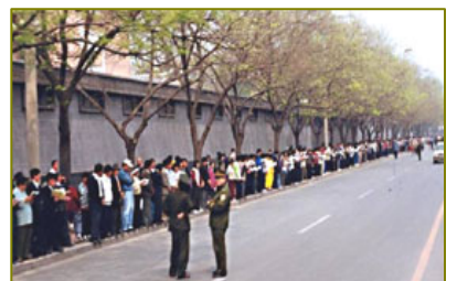
图：1999 年 4 月 25 日上访当天，法轮功学员文明安静，警察不用维持秩序，在一旁聊天。所谓的“围攻中南海”根本不存在。

江泽民曾一度独揽大权，曾同时担任中共总书记、中共国家主席、中共中央军委主席。在持续 13 年的针对法轮功的迫害中，军队是迫害的重要一环。1999 年 4 月 25 日，上万名法轮功学员出现在中南海国务院信访办公室前，向当局和平请愿。史称“4·25”。当天中共中央军事委员会副主席张万年接到党魁兼军委主席江泽民的指示，要求全军特别