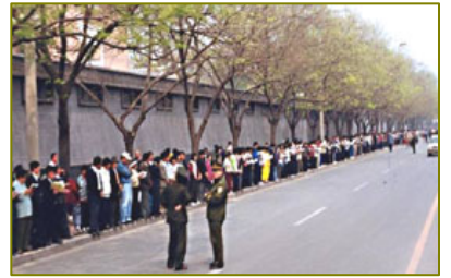
图：1999 年 4 月 25 日上访当天，法轮功学员文明安静，警察不用维持秩序，在一旁聊天。所谓的“围攻中南海”根本不存在。

江泽民曾一度独揽大权，曾同时担任中共总书记、中共国家主席、中共中央军委主席。在持续 13 年的针对法轮功的迫害中，军队是迫害的重要一环。1999 年 4 月 25 日，上万名法轮功学员出现在中南海国务院信访办公室前，向当局和平请愿。史称“4·25”。当天中共中央军事委员会副主席张万年接到党魁兼军委主席江泽民的指示，要求全军特别