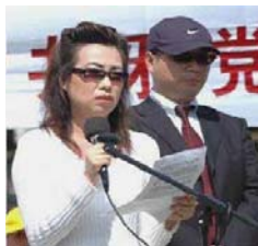
图：2006年在白宫附近证人安妮与皮特现身揭露中共活体摘取法轮功学员器官的滔天罪行。

5月7日，老军医揭露了在北京秘密召开的“中央军委处理涉外宗教问题会议”中的一些内容，针对集中营绝密信息大量外泄，“中央军委”要求进一步强化保密体系，封闭法轮功的信息渠道；要求对声援法轮功的非法轮功人员按法轮功人员处理；将顽固不化的不受控的基督教、天主教等教徒与法轮功学员同等对待，将迫害法轮功扩大化。同时，