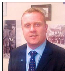
图：苏格兰议会议员鲍勃·多瑞斯

近来，由多个国家医生组成的国际组织“医生反对强制摘取器官协会”发起了请愿书，促请联合国派出独立调查组对中共活摘器官的暴行