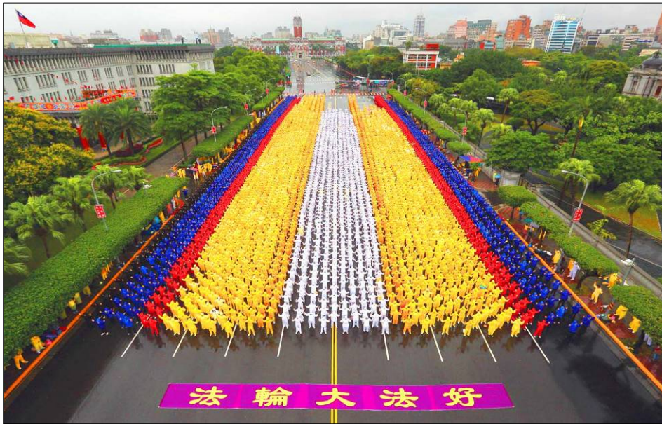
图：六千多名法轮功学员在总统府前的凯达格兰大道上集体炼功