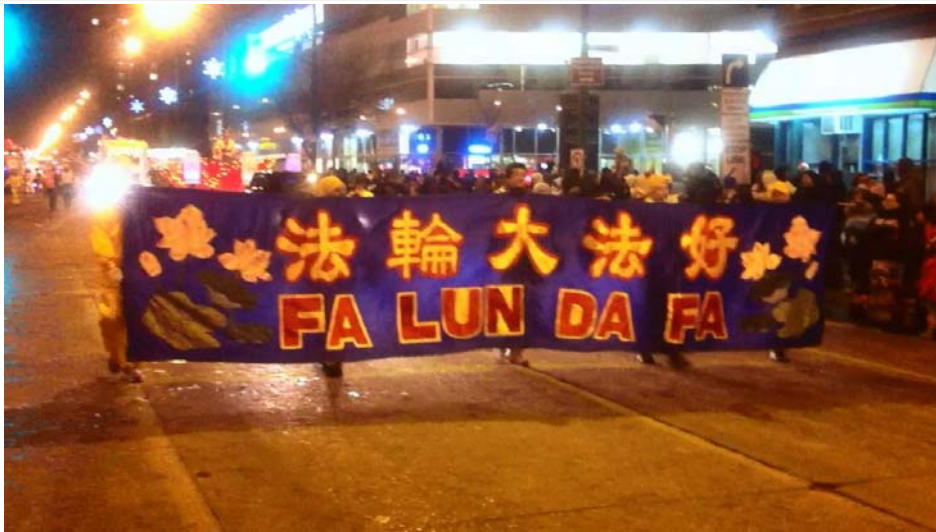
图：法轮功学员参加加拿大温尼伯二零一二年圣诞游行