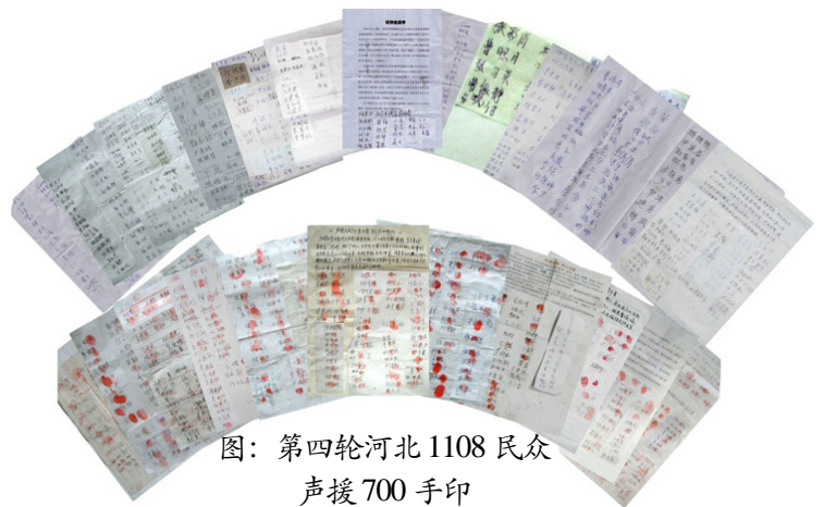
图：第四轮河北1108民众 声援700手印