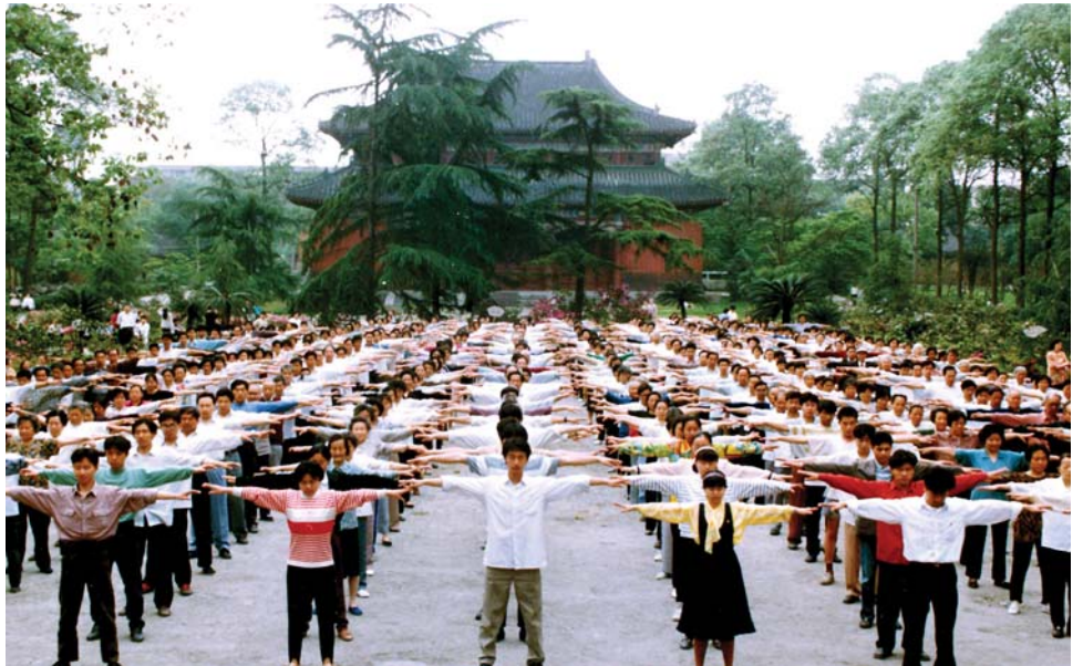
历史图片：1999年迫害发生前四川成都法轮功学员集体炼功

母身边。第二天，我对家人说，我现在的精神状态极差，我不知道自己接下来会怎么样，这次能回来见到你们我很高兴，我一直怕不能回来见你们了。我母亲和我妹妹们修炼法轮大法有半年了，她们告诉我别担心，说我这个病国外先进的医疗治疗不了，国内的中医、一般的气功也解决不了，只有修炼法轮大法，才能真正救了我。我从小受中共邪党无神论的教育，对修炼没有任何认识，但心里却非常肯定地感觉到只有法轮大法能救我。从此我走上了修炼法轮大法的神圣之路。