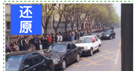
▲ 图为 1999 年 4 月 25 日万名法轮功学员集体和平上访现场。注意：街道上汽车、自行车都可以正常行驶，社会秩序正常。却被中共诬陷为“围攻中南海”

提到薄、谷活摘器官内幕，他们不吭气了。问这样的反人类罪行是否邪恶？他们说邪恶。义工问：如果善恶有报的话，邪恶中共是不是要遭天惩？“天灭中共，三退保平安”，难道是空话、大话吗？你们做“三退”，不是为了法轮功，也不是为了什么政治目的，是为你们自己的安全。远离邪恶，才有未来。他们中的人大部份同意退出中共党、团、队组织。没有退的，也接了真相资料，或表示自己上网看看再决定。◇