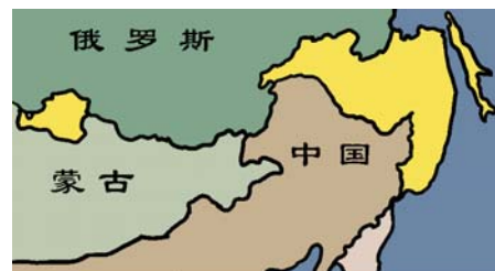
至少达100多万平方公里被侵占的中国领土被江泽民正式划入俄罗斯

所以，中共是我们中华民族的卖国贼！反党是爱国，不但无罪，而且有功，退出中共，和平解体这个反天、反地、反人民的邪党，中华民族才有希望，人民才能幸福安康！堂堂中华儿女，请脱离中共，找回自己做人的尊严！◇