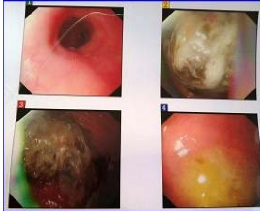
学法轮功前拍片，有胃结石