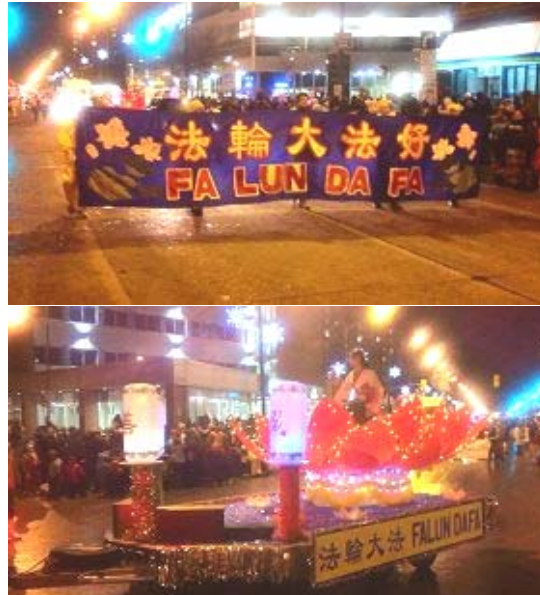
法轮功学员参加加拿大温尼伯二零一二年圣诞游行

时候, 就有不少行人被法轮功学员的莲花花车所吸引, 纷纷驻足拍照留念。这花车与众不同, 中间是一个美丽的大莲花, 上面坐着仙女装扮的法轮功学员, 前面有三个大灯笼, 上面写着“真善忍”三个汉字, 特别引人注目。队伍的最前面是一条七米长的横幅, 上面写着“法轮大法好”字样, 并有莲花点缀, 沿途赢得观众的赞叹和欢呼, 很多人跟着念横幅上面的字。