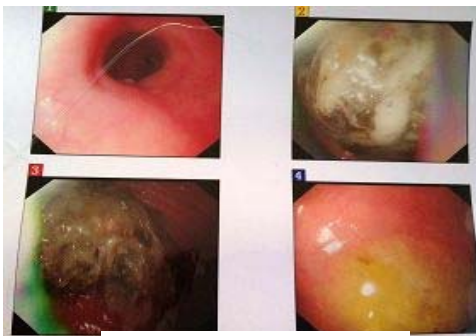
学法前拍片, 有胃结