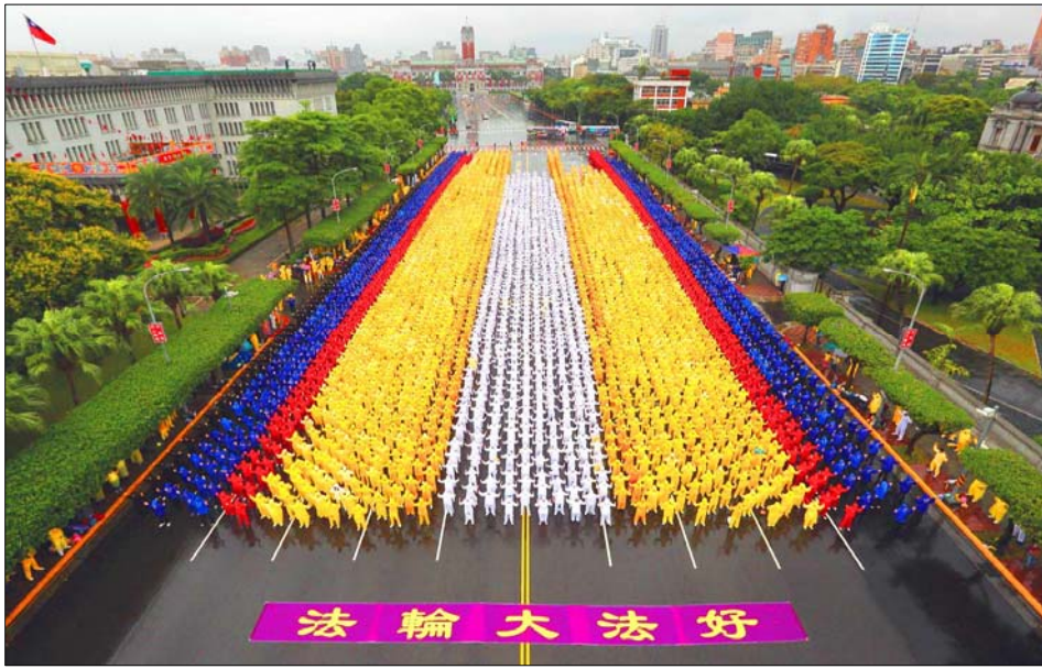
图：六千多名法轮功学员在总统府前的凯达格兰大道上集体炼功