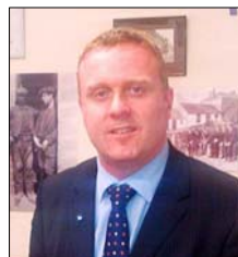
图：苏格兰议会议员鲍勃·多瑞斯

近来，由多个国家医生组成的国际组织“医生反对强制摘取器官协会”发起了请愿书，促请联合国派出独立调查组对中共活摘器官的暴行