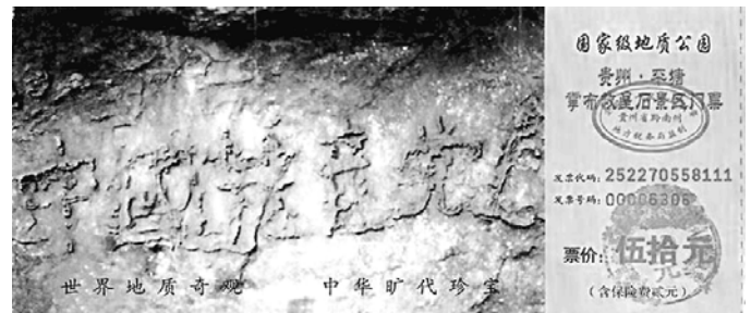
贵州省平塘县掌布乡“藏字石”风景区门票

最近有一个非常时尚的说法：“通宿看帖子，等天亮”，众多的跟帖说：“快天亮了”（寓意，中共快完了）。民意如此，天意亦然。2002年6月，在贵州平塘县掌布乡发现了一块石头，500年前崩裂，巨石断面内，惊现6个排列整齐的大字“中國共產黨亡”，字迹清晰，似浮雕突出石面，而且“亡”字特别大。2003年12月，中科院地质学家15人，实地考察后一致认为：该“藏字石”距今2.7亿年，其字为天然形成，非人工雕凿。上天已给中共敲响了灭亡的丧钟，借用巨石传达天意。