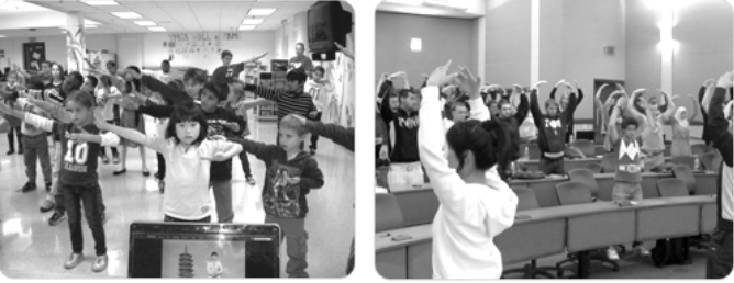
美国小学生在学炼 法轮功