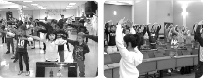
美国小学生在学炼 法轮功