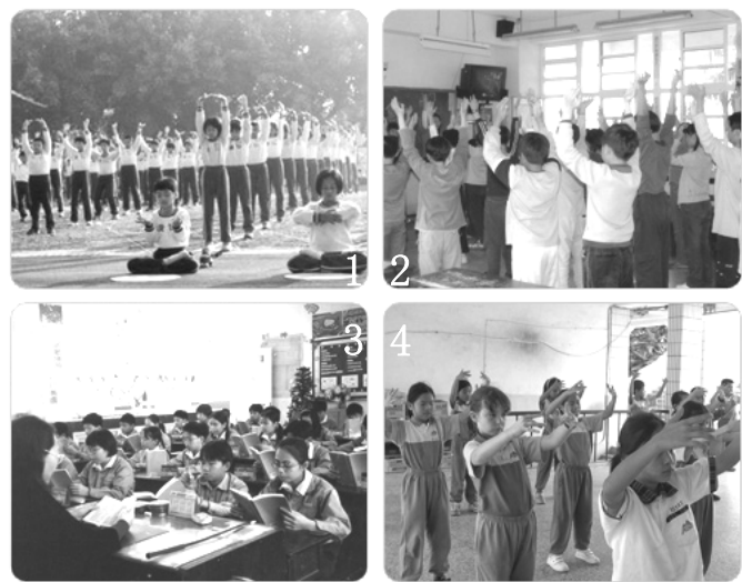
图 1 为台湾屏东市区中心学校 5 年级的 300 多位修炼法轮功的小弟子在炼功；图 2 为台湾彰化市泰和国小学生在炼功；图 3 为台湾彰化市泰和国小学生在读法轮功书籍；图 4 为台湾花莲明义国小学生在炼法轮功。

中国大陆和世界，为何如此不同 13 年来，法轮功不畏中共迫害，在世界 100 多个国家和地区弘扬，包括一水之邻的台湾。中共专制下的大陆和世界如此不同，这难道不令人深思吗？