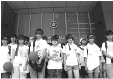
图为香港学生反洗脑行动

香港学生身穿白色衣服，以红色纱布蒙着眼睛，手持红色气球游行，喻意本来思想纯洁的学生，拒绝被染红洗脑。