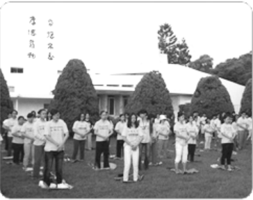
（如上图）二零一二年八月，第十三届法轮大

在台湾，有许多大中小学生修炼法轮功。台湾是除中国大陆外，修炼法轮功人数最多的地区，目前至少有几十万人在修炼法轮功。