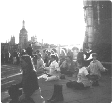
晨曦中，法轮功学员在国王学院楼前炼功

剑桥大学，这所有 800 多年历史的世界顶尖学府，曾经诞生了 87 位诺贝尔奖得主；如今，法轮功特有的清新纯正，正深深吸引着学风鼎盛的剑桥人。