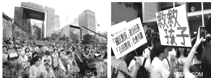
10 万港人 9 月 8 日继续在政府总部外集会，要求撤回中共洗脑式的国民教育

手抱两岁女儿参加游行的钟先生道出了人们的心声：“不希望我的女儿将来以为一党专政是好的，也不希望她以为六四事件没有死过人，不希望她以为共产党等于中国。”他说，“最反感的是，这是一个共产党宣传自己的一个节目，它们不说真相，我怕我的女儿以后不知道真相，不知道历史，不懂得独立思考的能力，不懂得分辨是非。”他希望任何这种形式的国民教育不仅不要在香港推行，全中国都不要推行。