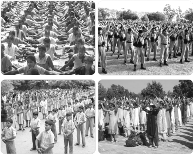
图为印度学生炼功的场景

在台湾，有许多大中小学生修炼法轮功。台湾是除中国大陆外，修炼法轮功人数最多的地区，目前至少有几十万人在修炼法轮功。