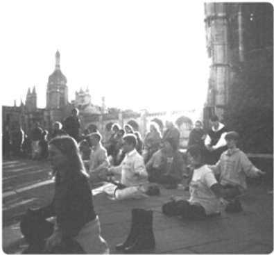
晨曦中，法轮功学员在国王学院楼前炼功

剑桥大学，这所有 800 多年历史的世界顶尖学府，曾经诞生了 87 位诺贝尔奖得主；如今，法轮功特有的清新纯正，正深深吸引着学风鼎盛的剑桥人。