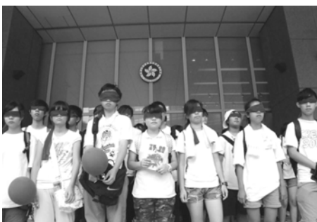
图为香港学生反洗脑行动

香港学生身穿白色衣服，以红色纱布蒙着眼睛，手持红色气球游行，喻意本来思想纯洁的学生，拒绝被染红洗脑。