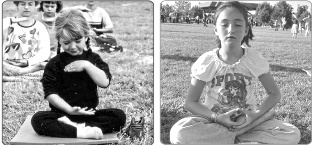
西方法轮功小弟子在打坐

法轮功走进西班牙校园，上左图为西班牙萨拉戈萨市公立学校（la Estrella）师生一起学炼法轮功第一套功法；上右图为师生们一起学炼第二套功法——法轮桩法。