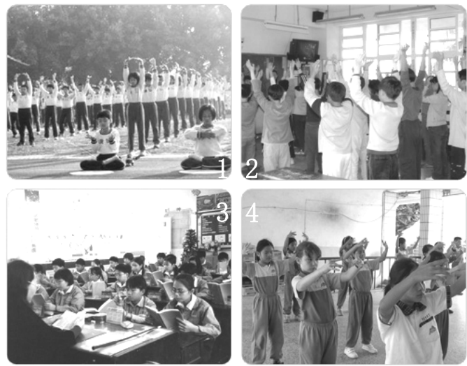
图 1 为台湾屏东市区中心学校 5 年级的 300 多位修炼法轮功的小弟子在炼功；图 2 为台湾彰化市泰和国小学生在炼功；图 3 为台湾彰化市泰和国小学生在读法轮功书籍；图 4 为台湾花莲明义国小学生在炼法轮功。

中国大陆和世界，为何如此不同 13 年来，法轮功不畏中共迫害，在世界 100 多个国家和地区弘扬，包括一水之邻的台湾。中共专制下的大陆和世界如此不同，这难道不令人深思吗？