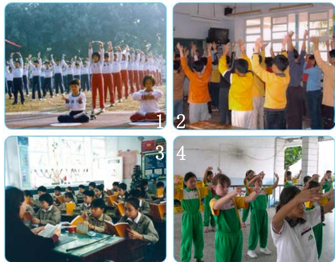
图 1 为台湾屏东市区中心学校 5 年级的 300 多位修炼法轮功的小弟子在炼功；图 2 为台湾彰化市泰和国小学生在炼功；图 3 为台湾彰化市泰和国小学生在读法轮功书籍；图 4 为台湾花莲明义国小学生在炼法轮功。

中国大陆和世界，为何如此不同 13 年来，法轮功不畏中共迫害，在世界 100 多个国家和地区弘扬，包括一水之邻的台湾。中共专制下的大陆和世界如此不同，这难道不令人深思吗？