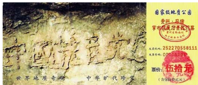
贵州省平塘县掌布乡“藏字石”风景区门票

最近有一个非常时尚的说法：“通宿看帖子，等天亮”，众多的跟帖说：“快天亮了”（寓意，中共快完了）。民意如此，天意亦然。2002年6月，在贵州平塘县掌布乡发现了一块石头，500年前崩裂，巨石断面内，惊现6个排列整齐的大字“中國共產黨亡”，字迹清晰，似浮雕突出石面，而且“亡”字特别大。2003年12月，中科院地质学家15人，实地考察后一致认为：该“藏字石”距今2.7亿年，其字为天然形成，非人工雕凿。上天已给中共敲响了灭亡的丧钟，借用巨石传达天意。