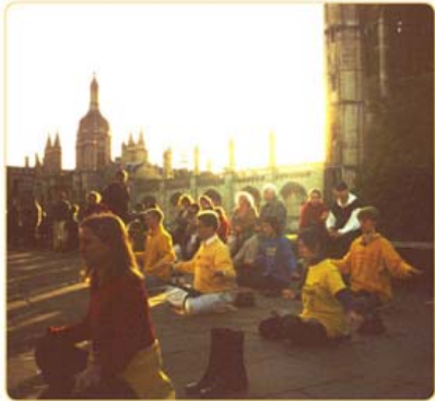
晨曦中，法轮功学员在国王学院楼前炼功

剑桥大学，这所有 800 多年历史的世界顶尖学府，曾经诞生了 87 位诺贝尔奖得主；如今，法轮功特有的清新纯正，正深深吸引着学风鼎盛的剑桥人。