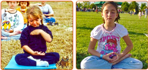
西方法轮功小弟子在打坐

法轮功走进西班牙校园，上左图为西班牙萨拉戈萨市公立学校（la Estrella）师生一起学炼法轮功第一套功法；上右图为师生们一起学炼第二套功法——法轮桩法。