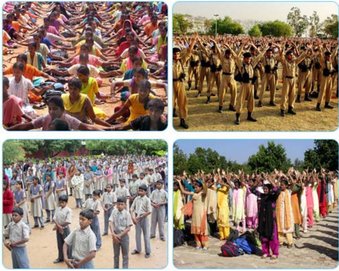
图为印度学生炼功的场景

在台湾，有许多大中小学生修炼法轮功。台湾是除中国大陆外，修炼法轮功人数最多的地区，目前至少有几十万人在修炼法轮功。