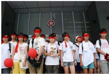
图为香港学生反洗脑行动

香港学生身穿白色衣服，以红色纱布蒙着眼睛，手持红色气球游行，喻意本来思想纯洁的学生，拒绝被染红洗脑。