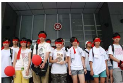
图为香港学生反洗脑行动

香港学生身穿白色衣服，以红色纱布蒙着眼睛，手持红色气球游行，喻意本来思想纯洁的学生，拒绝被染红洗脑。