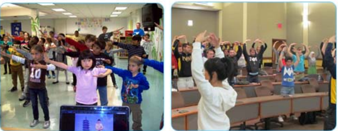
美国小学生在学炼 法轮功