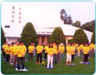
（如上图）二零一二年八月，第十三届法轮大

在台湾，有许多大中小学生修炼法轮功。台湾是除中国大陆外，修炼法轮功人数最多的地区，目前至少有几十万人在修炼法轮功。