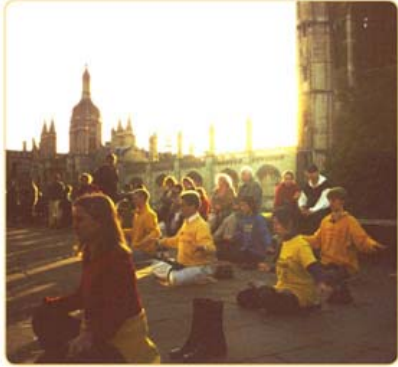
晨曦中，法轮功学员在国王学院楼前炼功

剑桥大学，这所有 800 多年历史的世界顶尖学府，曾经诞生了 87 位诺贝尔奖得主；如今，法轮功特有的清新纯正，正深深吸引着学风鼎盛的剑桥人。