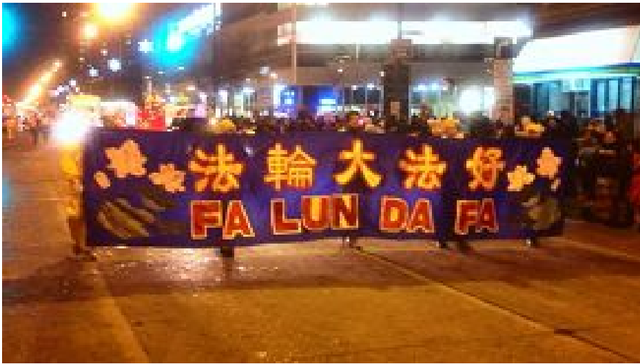
图：法轮功学员参加加拿大温尼伯二零一二年圣诞游行